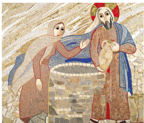
“Se tu conoscessi il dono di Dio “ (Gv 4,10) Gesù con la Samaritana – M. Rupnik

Il Signore è vicino a chi ha il cuore ferito ” L’incontro con Gesù risana i conflitti”